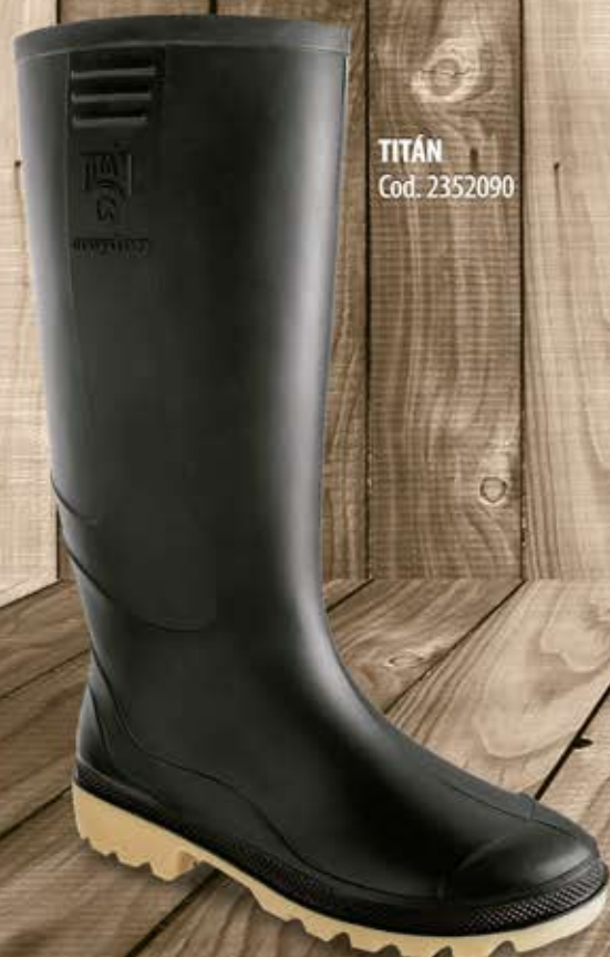
TITÁN Cod. 2352090